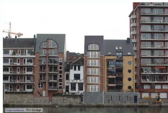
Construction d'un Immeuble à appartements à JAMBES