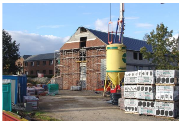
Maison de repos « LA MERIDIENNE » à MEUX