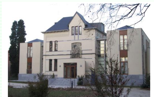
Comptoir d'escompte de DEXIA