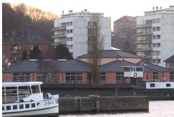
Ecole de Basse Henhaive