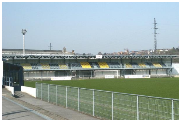
Construction d'une Tribune au RFC NAMUR