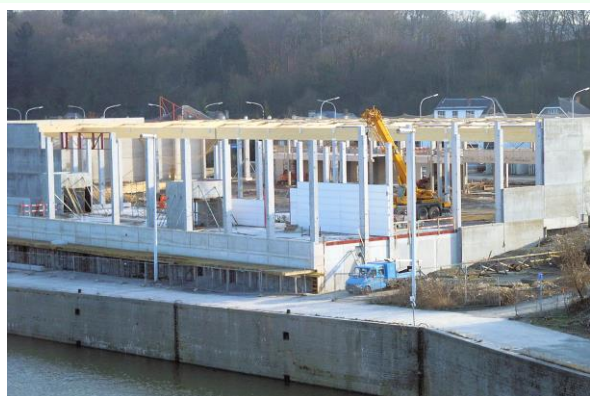
Construction du BRICO à JAMBES