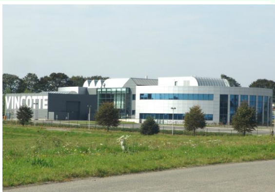
Siège social de l'A.I.B. Vinçotte au Parc CREALYS