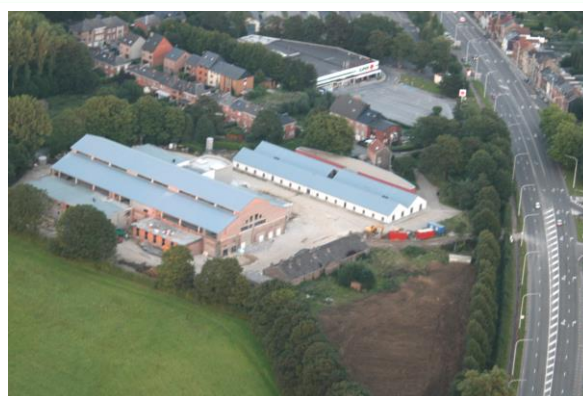
Centre de tri pour LA POSTE à Belgrade