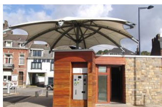
Structure « parapluie » Plaine St Nicolas