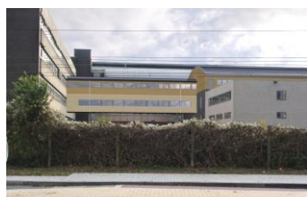
Image de synthèse au CHR de Namur

Siège Social de l'A.I.B. Vinçotte au parc CREALYS Isnes, Rénovation d'in immeuble rue Marché aux Grains à Bruxelles, Aménagement de la Place Nassau à Corroy-le-Château,...