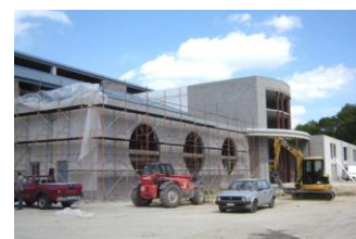
Espaces bureaux « ACTIBEL » à Belgrade