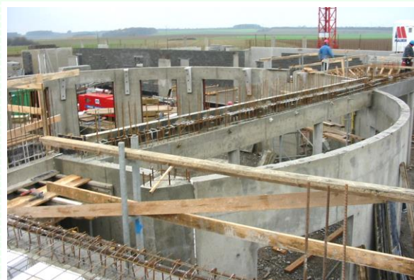
Centre de Formation I.F.A.P.M.E à Villers-le-Bouillet